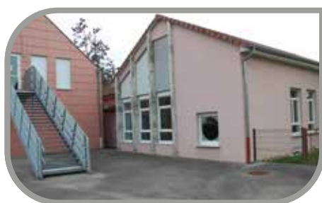
Extension périscolaire Brunstatt

Après avoir accepté un legs et pris connaissance du compte rendu des commandes passées entre le 2 mai et le 31 octobre 2019, le Conseil Municipal a approuvé le rapport d'activités 2018 de Mulhouse Alsace Agglomération. Puis, les élus ont voté des autorisations de programme et des crédits de paiement dans le cadre de l'extension du bâtiment périscolaire rue du Fossé et de la création de locaux périscolaires dans les anciens locaux de la mairie de Didenheim avant d'adopter deux décisions budgétaires modificatives et de fixer la surtaxe communale sur l'eau.