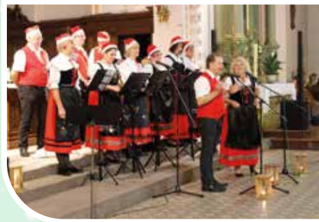
Musique Centre, des Luschtiga Wetzknüppa, de la Chorale des Enfants, du Gospel Rejoicing, de John and The Steeds et de la Chorale Saint-Grégoire.