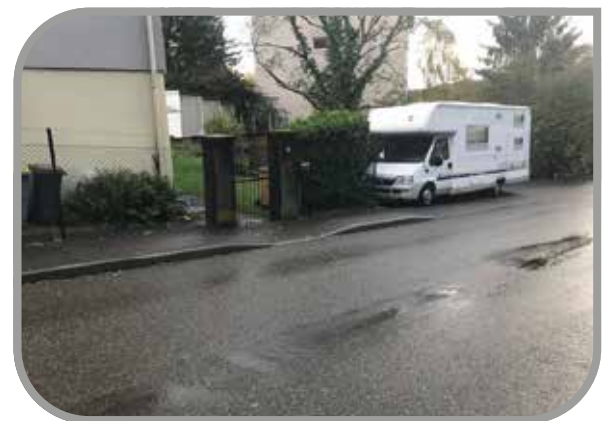
Rue de Lattre de Tassigny

de travaux pour des travaux d'abaissement de trottoir rue du Maréchal de Lattre de Tassigny, une convention avec Citya Etige Logement pour la pose d'un miroir rue Laennec et une convention de travaux pour des travaux d'abaissement de trottoir rue Clémenceau. Enfin, les élus ont procédé à des régularisations foncières Chemin des Pèlerins et rue Bellevue, avant de décider la vente d'une parcelle communale rue de la Nouvelle-Zélande.