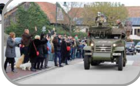
24 à 27 Le 75 e anniversaire de la Libération