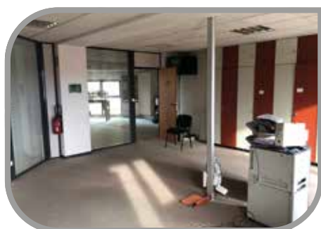
Mairie Didenheim 1 er étage

Les conseillers ont alors validé la clôture du budget annexe de l'eau au 31 décembre 2019 et ont approuvé le rapport annuel 2018 du service public de l'eau potable. Il fut ensuite décidé d'adhérer au contrat groupe d'assurance statutaire du Centre de Gestion du Haut-Rhin et de valider la convention extra-scolaire avec la Fédération des Foyers Clubs d'Alsace. Le Conseil Municipal a également décidé la fusion de l'Ecole Maternelle « Les Castors » et de l'Ecole Elémentaire « La Sirène de l'ill » à compter de la rentrée de septembre 2020. S'agissant du service de Police Municipale, les élus ont validé la prise de compétence « Gestion de la fourrière automobile » ainsi que la mise en commun de policiers municipaux avec la Commune d'Ottmarsheim à l'occasion du 75 ème anniversaire de la Libération de Brunstatt-Didenheim. Les conseillers ont alors émis un avis favorable au transfert du droit de chasse