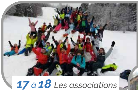
17 à 18 Les associations