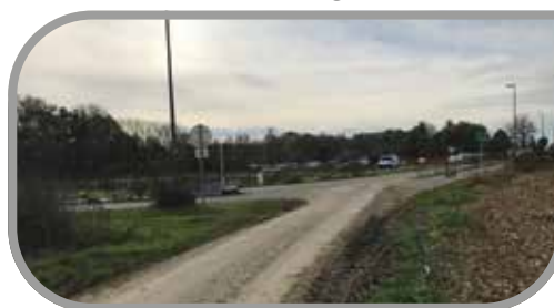
Chemin dit du Zillisheimerweg à Didenheim

En matière d'urbanisme, fut décidée la signature d'une convention de mise à disposition gratuite et temporaire d'un terrain ainsi que la signature d'une convention avec la Commune de Zillisheim pour le financement et l'entretien de trois bornes sur le chemin dit du Zillisheimerweg à Didenheim.