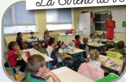
Ecole élémentaire La Sirène de l'Il