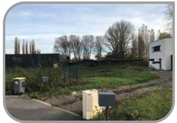
rue de la Terre Noire

approuvées une convention de mise en souterrain du réseau Orange rue du 25 Novembre, une convention de mise à disposition temporaire d'un terrain rue de la Terre Noire, une convention avec Nexity pour la réalisation de travaux de sécurisation de l'aire de présentation des containers des ordures ménagères rue de l'illberg, une convention