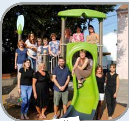
Ecole maternelle du Centre