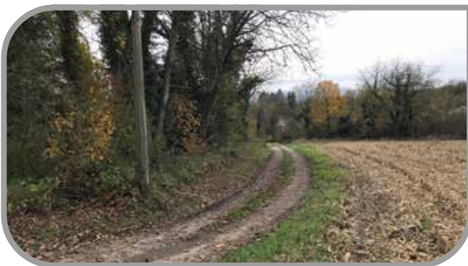
Chemin des Apiculteurs

Dans le cadre du devenir des réseaux câblés, les conseillers ont approuvé la constitution d'un groupement de commandes pour la passation d'un accord-cadre pour une mission d'assistance à maîtrise d'ouvrage, avant d'émettre un avis défavorable à la révision des statuts du Syndicat d'Electricité et de Gaz du Haut-Rhin.