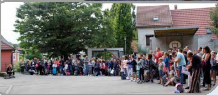
Ecole maternelle Les Castors